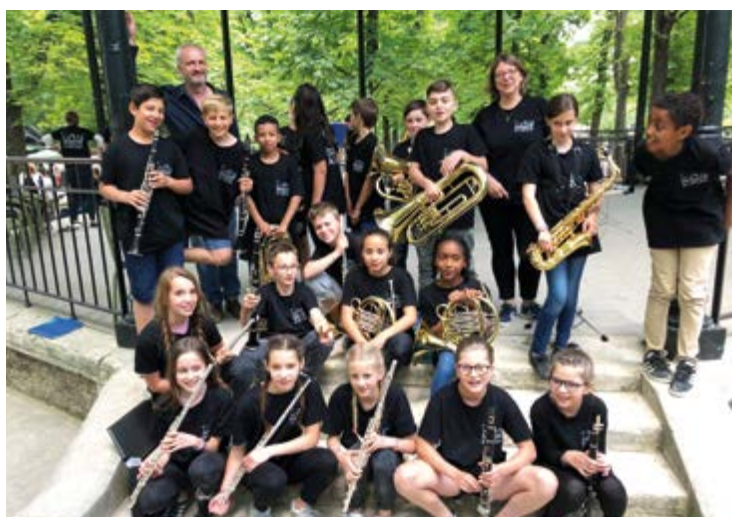
Orchestre de l'école Jean Vilar en 2018

Les enfants étaient ravis de pouvoir échanger avec le ministre et notre députée sur leurs propositions concernant l'usage des outils numériques. Un processus de sélection des différentes propositions de loi sera ensuite réalisé au niveau académique puis national. Les classes participant au Parlement des enfants doivent ensuite départager par un vote la proposition de loi retenue. ■