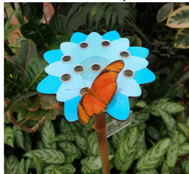
Parc Floral à Orléans La Source