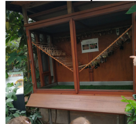
Serre aux papillons